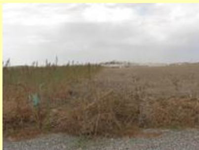
de grond ligt nu nog braak

komende maanden graag op de hoogte houden van dit bijzondere project. Lees hier een uitgebreide toelichting op dit initiatief.